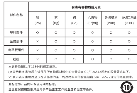
产品中有毒有害物质或元素的名称及含量标识表

※The product specification is subject to change without prior notice.